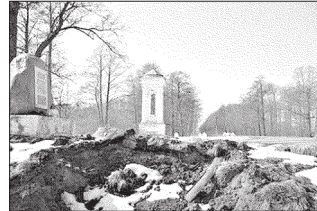
Разбураная пляцоўка ля Мілавідскага памятнага знака ўсталяванага ў 1993 г.

Баранавіцкія грамадскія актывісты сабравалі 148 подпісаў за тэрміновы рамонт помнікаў у гонар паўстанцаў 1863 г. і накіравалі іх старшыні Мілавідскага сельскага савета (Баранавіцкі раён) Ірыне Сушчык. У звароце паведамляецца, што ў вельмі дрэнным стане знаходзіцца пляцоўка ля Мілавідскага памятнага знака ў гонар касінераў Кастуся Каліноўскага. Зусім кепскі выгляд мае і каталіцкая капліца, у якой вечер моцна пашкодзіў дах і сарваная бляха валяецца на зямлі.